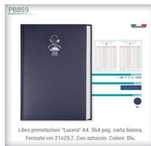
Libro prenotazioni "Lucera" A4. 564 pag. carta bianca. Formato cm 21x29,7. Con astuccio. Colore: Blu.