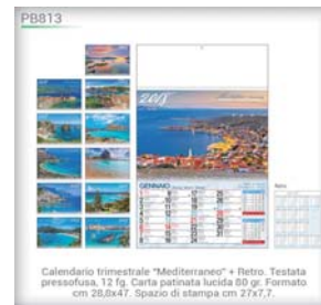
Calendario trimestrale "Mediterraneo" + Retro. Testata pressofusa, 12 fg. Carta patinata lucida 80 gr. Formato cm 28,8x47. Spazio di stampa cm 27x7,7.

GIORNALIERE SETTIMANALI MANAGER MAXI PLANNING DA TAVOLO TASCABILI