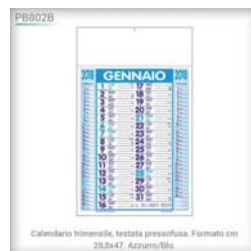
Calendario trimestrale, testata pressofusa. Formato cm 28,8x47. Azzurro/Blu.