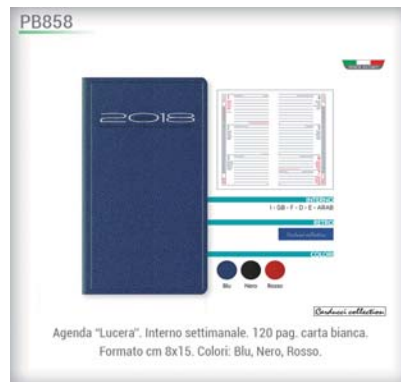
Agenda "Lucera". Interno settimanale. 120 pag. carta bianca. Formato cm 8x15. Colori: Blu, Nero, Rosso.