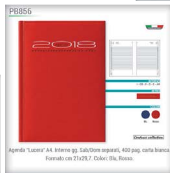
Agenda "Lucera" A4. Interno gg. Sab/Dom separati, 400 pag. carta bianca. Formato cm 21x29,7. Colori: Blu, Rosso.