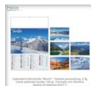
Calendario trimestrale "Natura". Testata pressofusa, 6 fg. Carta patinata lucida 120 gr. Formato cm 28,8x47. Rosso e Verde.