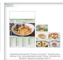
Calendario trimestrale "Passeo in Cucina". Testata pressofusa, 6 fg. Carta patinata lucida 120 gr. Formato cm 28,8x47. Spazio di stampa 22x7,7.