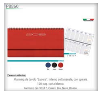
Planning da tavolo "Lucera". Interno settimanale, con spirale. 120 pag. carta bianca. Formato cm 30x17. Colori: Blu, Nero, Rosso.