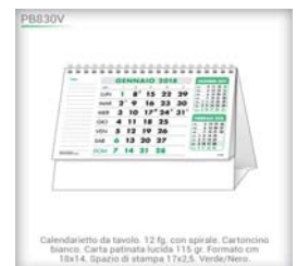
Calendarietto da tavolo. 12 fg. con spirale. Cartoncino bianco. Carta patinata lucida 115 gr. Formato cm 18x14. Spazio di stampa 17x2,5. Verde/Nero.