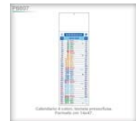
Calendario e agende personalizzate. Formato cm 15x7.