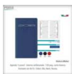
Agenda "Lucera". Interno settimanale. 120 pag. carta bianca. Formato cm 8x15. Colori: Blu, Nero, Rosso.